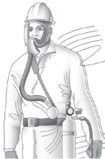
Respirador con suministro de aire (Supplied-Air Respirator, SAR) de máscara completa con un contenedor de escape auxiliar